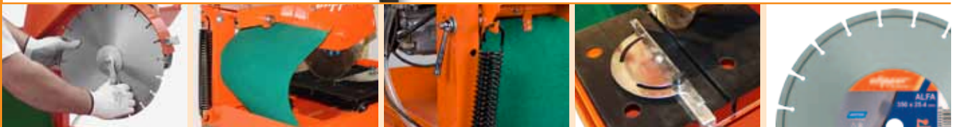
Schimbarea usoara a discului.