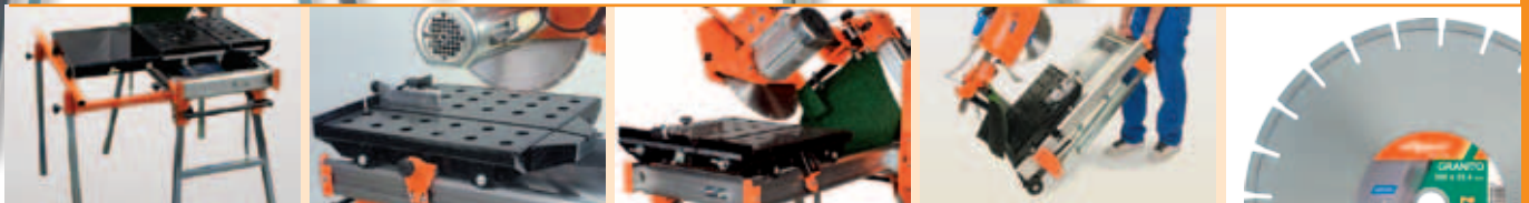
Extindere laterala. (accesoriu opțional)