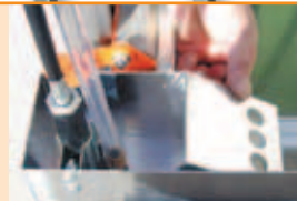
Pompa de apă mecanică.