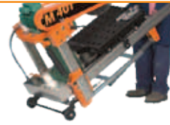
Ușor de transportat