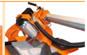
Sina si cap inclinate. (0 - 45°)