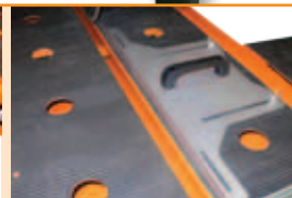
Ghid de taiere lateral.