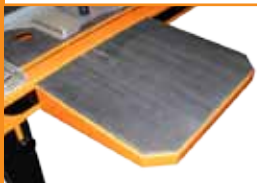
Extensie laterala incorporata.