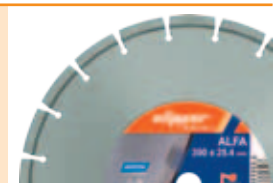
Vă recomandăm să utilizați discul diamantat Clipper ALFA