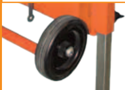
Roti de transport.