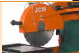
Protectia discului intotdeauna orizontala.