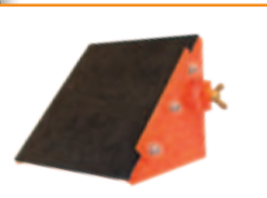
Unghi de tăiere 45° (accesoriu opțional)