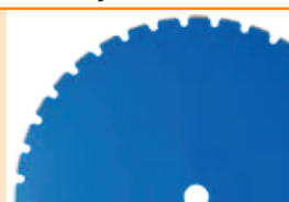
Vă recomandăm să utilizați discul diamantat Norton BS-U