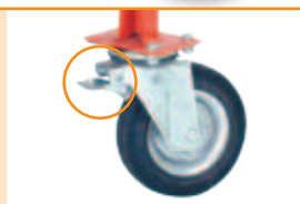
2 roti cu dispozitiv de blocare.