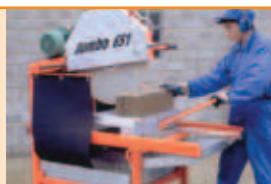
Cadru greu cu 4 roti.