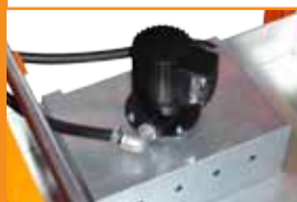
Pompă electrică pentru apă (Jumbo 651 6.75.3)