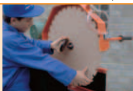
Acces facil la disc.