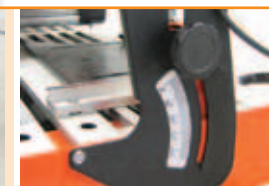
Cap de tăiere inclinabil (de la 0° la 45°)