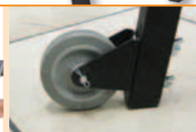
Roți pentru transportare