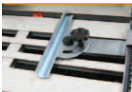
Ghid de tăiere