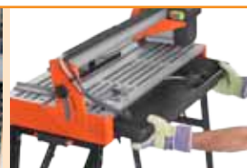
Tavă de apă detașabilă