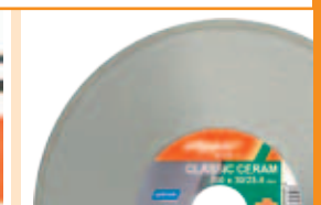
Mașina se livrează împreună cu discul diamantat Clipper CLASSIC CERAM Ø200mm