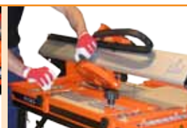
Ghidajul tăierii cu reglaj unghiular.