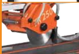
Sine de ghidare cu capul inclinabil de la 0 la 45°.

Noua noastră masina CLIPPER TR250H este o masina robusta si de calitate care completeaza perfect gama noastră de masini de taiat placi. Lungimea sa maxima atinge 1000mm.