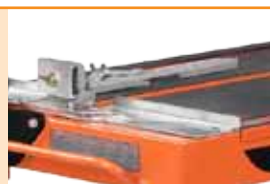
Ghidaj al taierii inclus.