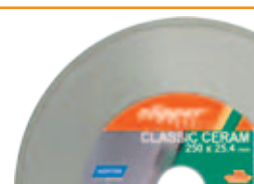
Mașina se livrează împreună cu discul diamantat Clipper CLASSIC CERAM Ø250mm