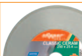
Mașina se livrează împreună cu discul diamantat Clipper CLASSIC CERAM Ø250mm