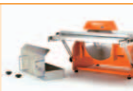
Rezervor de apa detasabil.