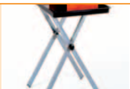
Picioare pliante (optiune).