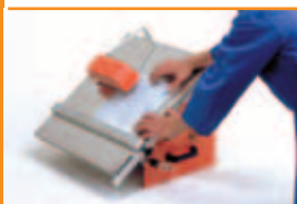
Masa inclinată (de la 0° la 45°).

O masina profesionala de taiat placi de mare productivitate cu o protectie unica a discului.